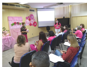
Ações do Outubro Rosa no Hemonorte