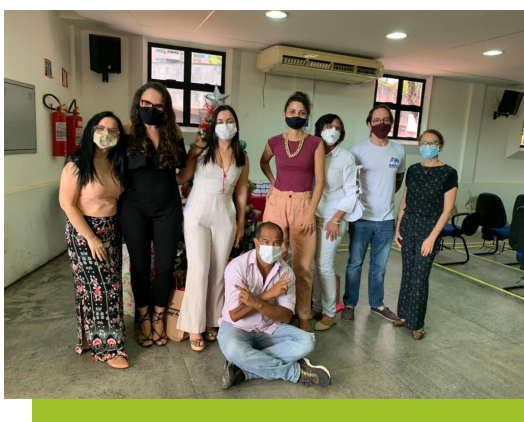
Núcleo Técnico e Núcleo Pedagógico