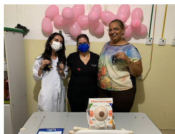
NASST do Hospital Regional Alfredo Mesquita - Macaíba