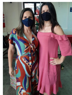
Núcleo Administrativo e Financeiro