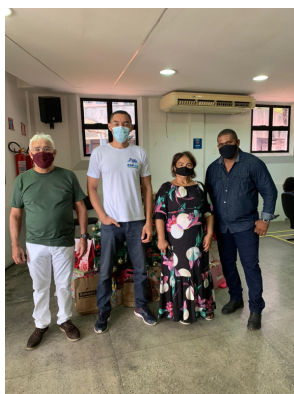
Apoio Manutenção e Logística