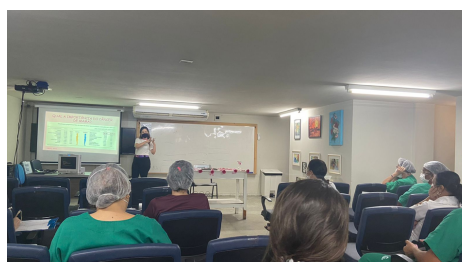
Outubro Rosa pelo NASST do Hospital Monsenhor Walfredo Gurgel - Natal