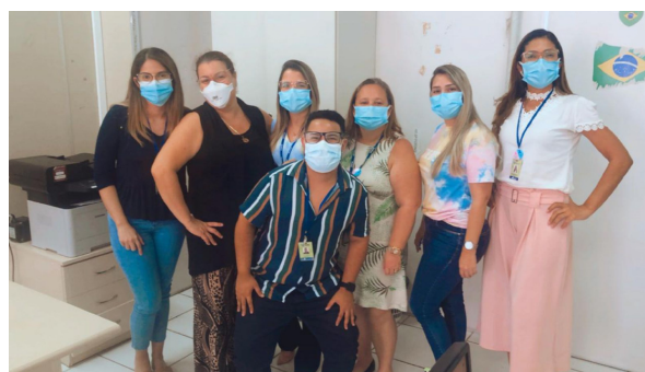
Outras imagens de trabalhos realizados pela equipe do NASST