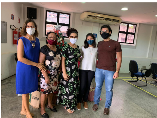
Equipe do Núcleo de Gestão do Trabalho e da Educação na Saúde - NGTES - ESPRN