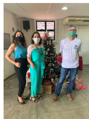
Núcleo de Inovação, Pesquisa e Extensão- NIPE