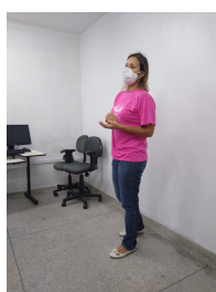
Outubro Rosa no Hospital da Polícia - Natal