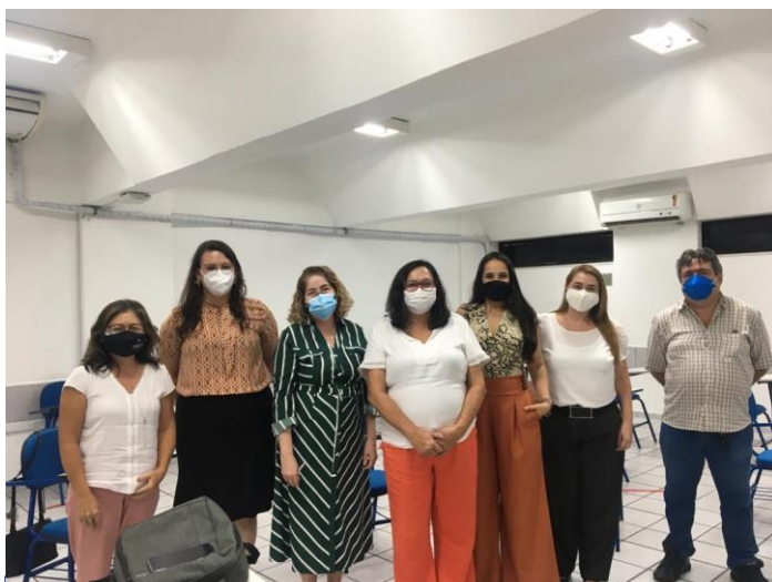
Reunião com o Conselho de Fisioterapia e Terapia

Com a finalidade de ajustar as diretrizes para o bom funcionamento dos serviços, a Coordenadoria de Gestão do Trabalho e Educação na Saúde (CGTES) vem mantendo uma agenda intensa de reuniões com os principais conselhos de classe da área da saúde. Entre eles o Conselho Regional de Serviço Social ( Cress ), o Conselho Regional de Fisioterapia e Terapia Ocupacional ( Crefito ), o Conselho Regional de Medicina do RN ( Cremern ), o Conselho Regional de Psicologia , entre outros.