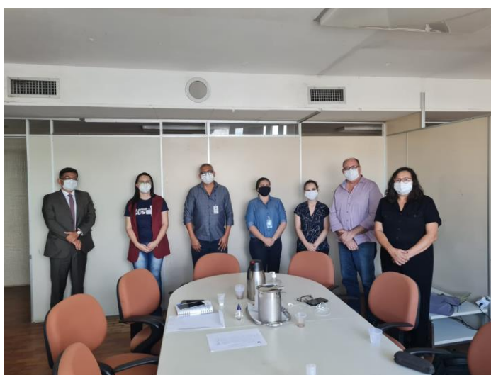
Reunião da CGTES e SAD com os Conselhos de Serviço Social, Psicologia, Medicina e Enfermagem

As atualizações para a retomada das atividades de ambulatórios, clínicas e demais atendimentos não-hospitalares descritos em portaria estão de acordo com as determinações dos governos estaduais e tanto gestores, quanto empresários precisam ficar atentos às alterações que visam impedir a transmissão do novo coronavírus e garantir assim a proteção de profissionais e pacientes.